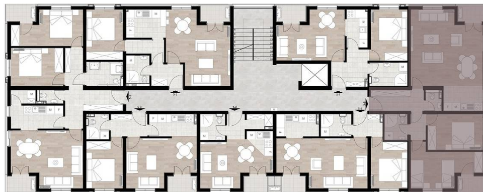
STAN 6 - DVOSOBAN TIP 2